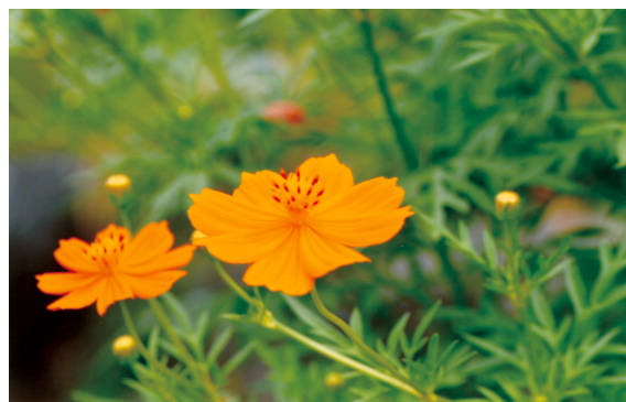
花名：キバナコスモス 花言葉：野性的な美しさ