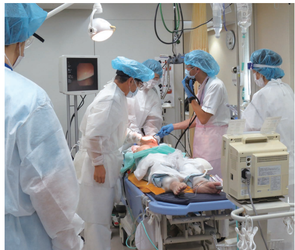
北棟2F 内視鏡室 胃瘻造設の様子