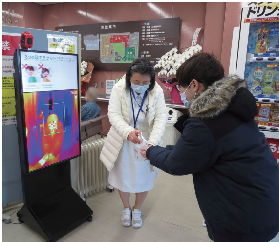
正面玄関 体温の測定と手指消毒の様子

当院の救急外来では、脳梗塞の他にも交通事故、骨折、めまい、食欲不振、など様々な患者さまを月平均約180件24時間体制で受け入れています。急性期治療から軽快し回復期リハビリテーションを経て在宅や施設へ退院を目指しています。その後の外来通院でも医療従事者としての責任を心がけて、今後も患者さまに関わって参りたいと思います。