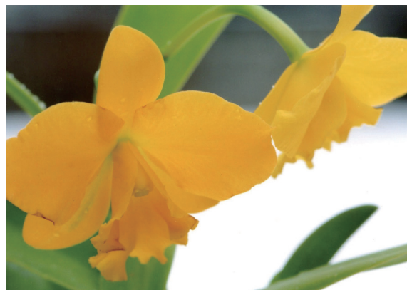
花名：ミニカトレア 花言葉：殊勝、恥じらい